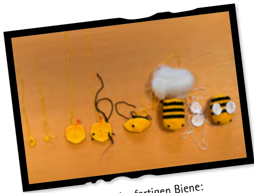
Größe der fertigen Biene: 7 cm lang, 5 cm im Durchmesser